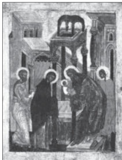
Сретение Господне. Псков. Икона XI в.

15 февраля — двенадцатый праздник Сретение Господа нашего Иисуса Христа.