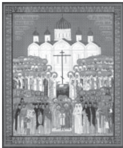
Икона Новомучеников и исповедников Российских. 2000 г.

13 февраля — Собор Новомучеников и исповедников Российских: свт. Тихона, патриарха Московского и всея Руси († 1925 г.), сщмч. Петра, митрополита Крутицкого († 1937 г.), сщмч. Владимира, митрополита Киевского и Галицкого († 1918 г.), сщмч. Вениамина, митрополита Петроградского и Гдовского и иже с ним убиенных сщмч. архим. Сергия, мчч. Юрия и Иоанна († 1922 г.), прмчч. вел. кн. Елисаветы и инокини Варвары († 1918 г.) и многих других.