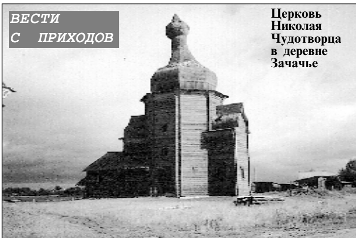
ВЕСТИ С ПРИХОДОВ